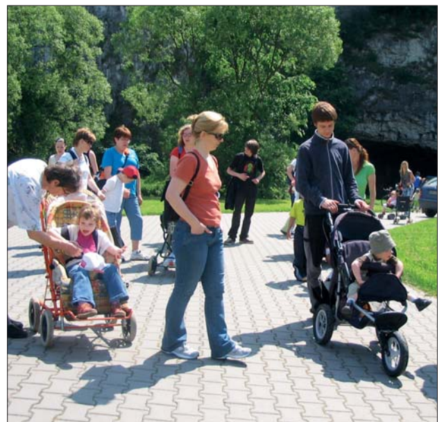
Děti z domova LILA na výletě ve Sloupu