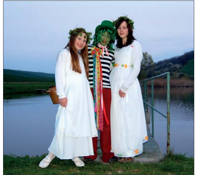
Vítání jara se světluškami