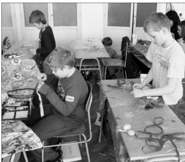
Výroba velikonoční pomlázky ve 4. třídě ZŠ

Extrémně dlouhé deštivě počasí naštvale všechny. Nepřetržitý déšť už o Velikonocích odradil nejednoho chlapce od tradičního mrskání. Za děvčaty vyrazili jen ti odvážní, jenž se vody nezalekli. A naštěstí jsou tu věrní sousedé, kteří našli cestu k sousedkám. Přesto si tetičky posteskly, že hochů, chlapců, mužů přišlo velmi málo. A tak spousta barevných vajíček a napečených dobrot zůstalo doma.