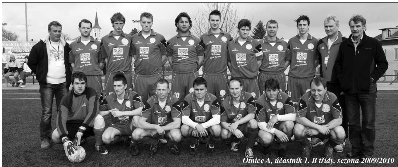
Omice A, účastník 1. B třídy, sezona 2009/2010