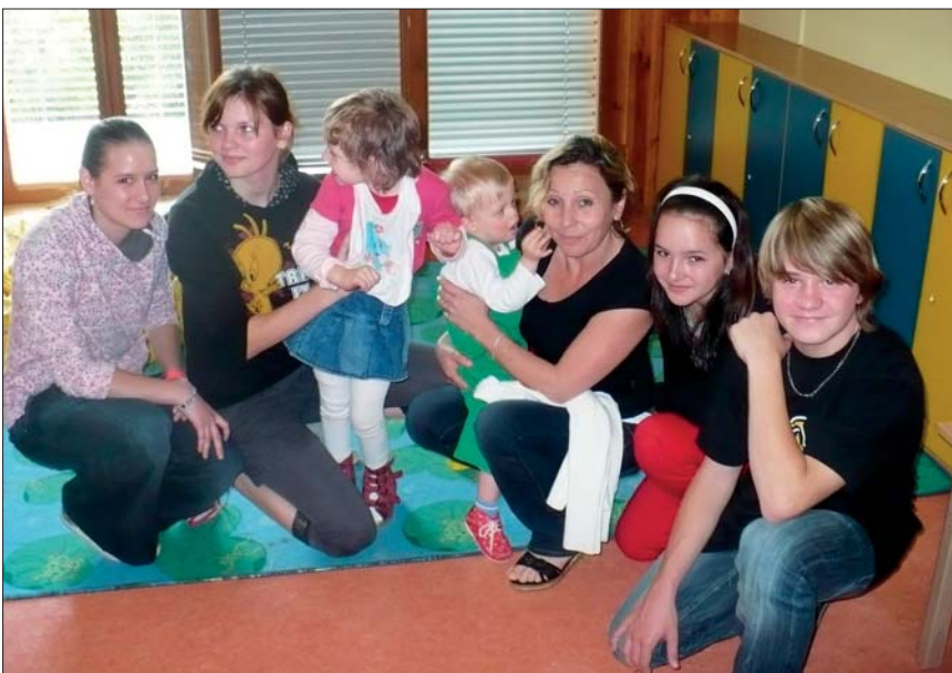
Den otevřených dveří v dětském domově LILA