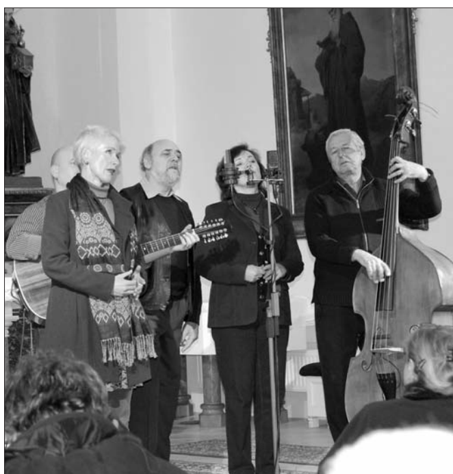
Spirituál kvintet v našem kostele