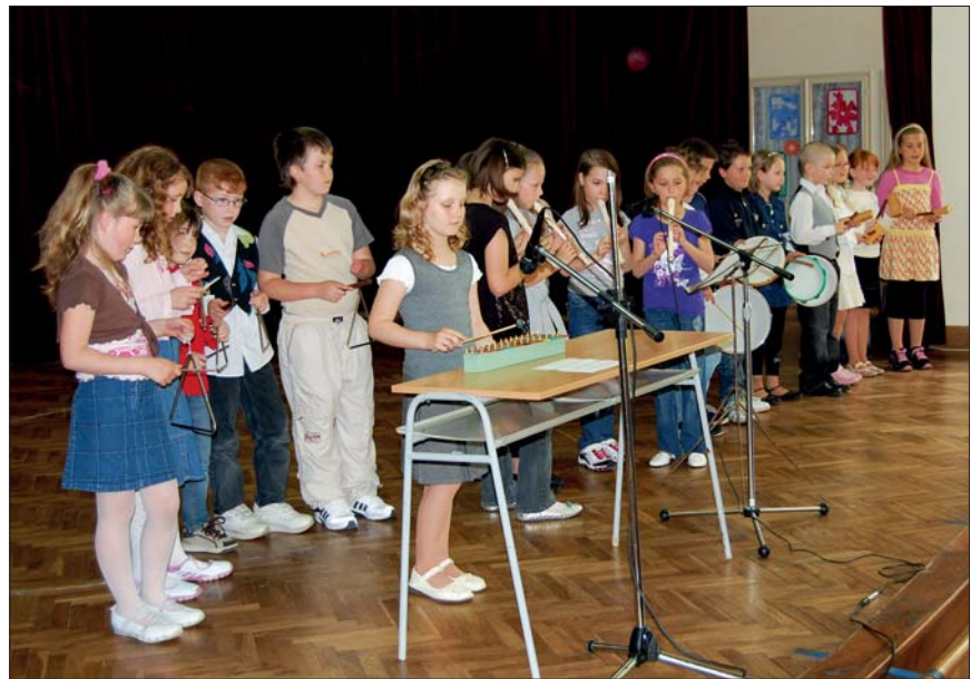
Besídka ke dni matek v ZŠ