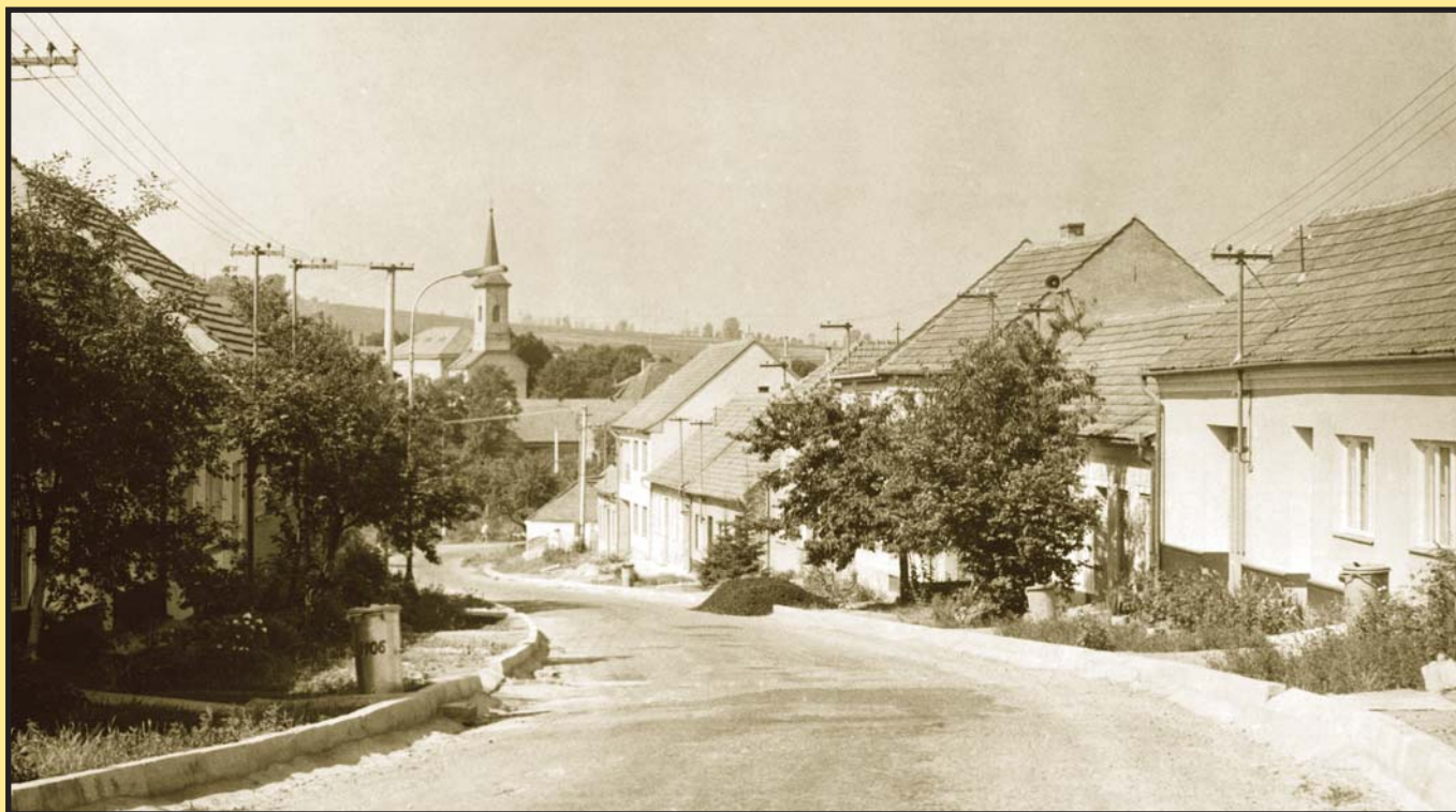
Ulice Milešovská – 70. léta...