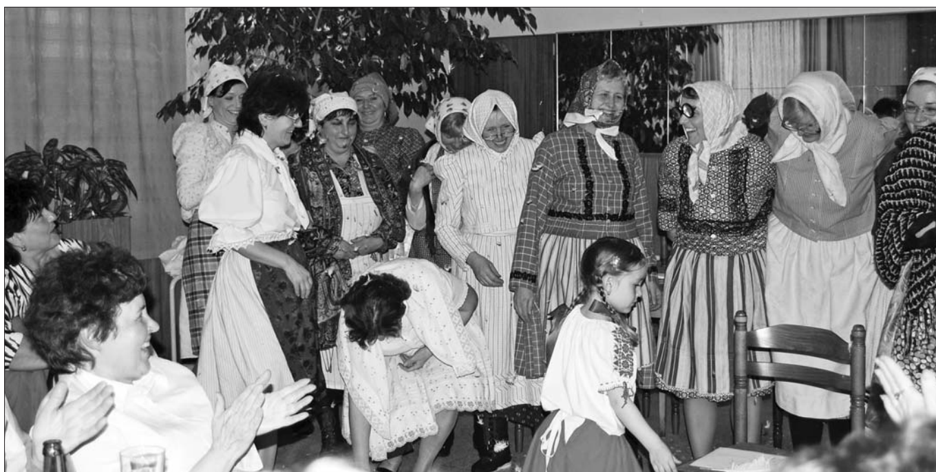
Foto: Zdeňka Křivánková z představení „Dračky nejsou žádné pláčky“