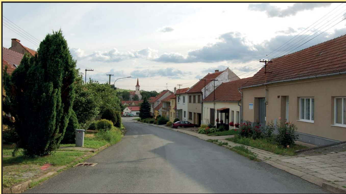
... a dnes.